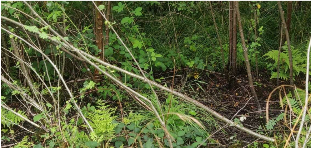
Figur 3. Den tilgroede mose (1) under opvæksten ses bl.a. mosebunke, brombær og bregnen mangeløv.