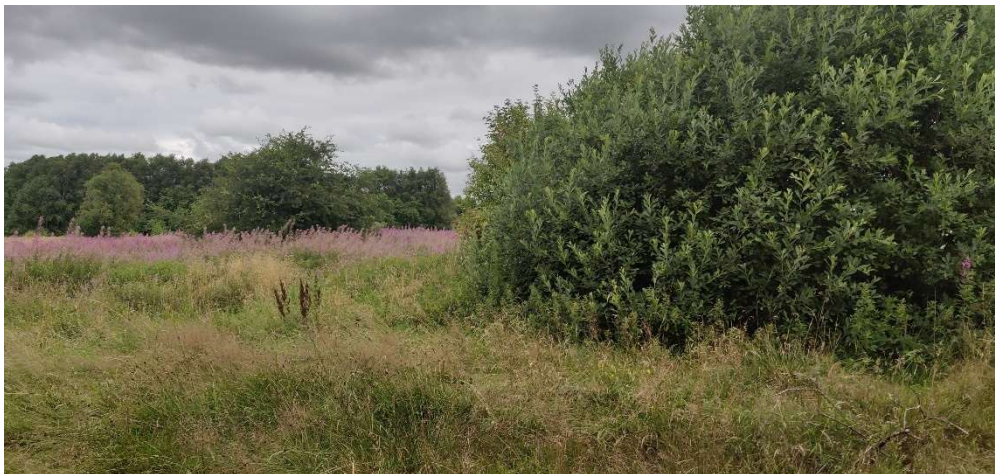
Figur 4. Ugræsset eng (4) billedet er taget mod nord og vandløbet løber i højre side af billedet bag pilen.

Naturbeskyttelsesloven indeholder et forbud mod at ændre beskyttede naturområders tilstand. Loven giver dog mulighed for, at kommunen i særlige tilfælde kan gøre undtagelser fra forbuddet. Her gives der dispensation til de mindre ændringer, der kan ske i de vandløbsnære arealer, samt til oprensningen i selve vandløbet.