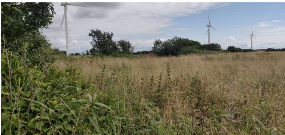
Figur 7. Den ugræssede eng (7) mod syd, vandløbet løber langs el og pilene midt i billedet.