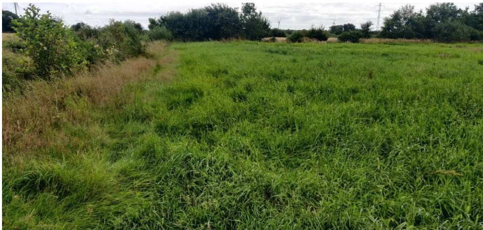
Figur 6. Engen (6) slås jævnligt, nok mest af jagtmæssige hensyn. Novrup Bæk løber til venstre i billedet.