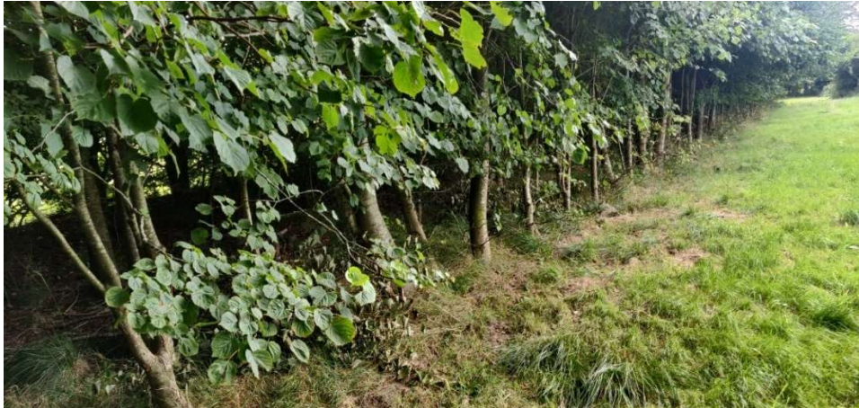
Figur 5. Novrup Bæk løber langs de tre træerækker der ses på billedet. Her ses tydeligt, at det vandløbsnære areal er tørt.